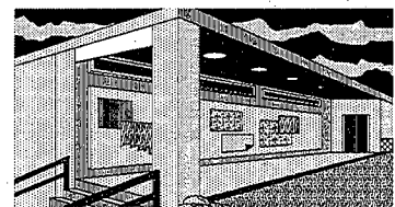
Dans ce chemin on trouve notre Maison de quartier d'Aïre-Le Lignon

L'association Nicolas Bogueret a construit dans cette partie de la commune, de nombreux logements à caractère social.