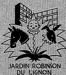
JARDIN ROBINSON DU LIGNON